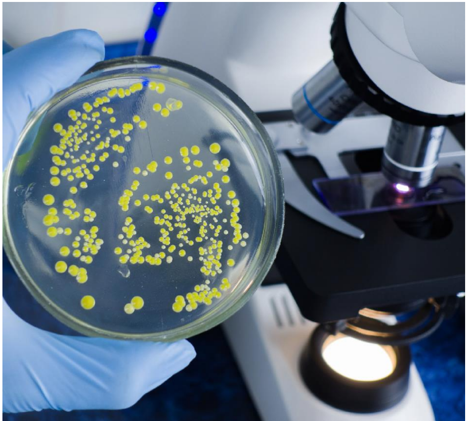
Laboruntersuchung zu Bakterien

einem erhöhten Bedarf an teureren Medikamenten