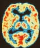
Cerveau en bonne santé